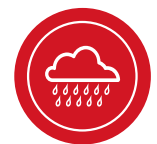
Etanchéité à partir de 10°