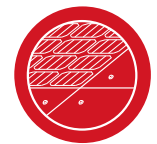
Plaques complémentaires Aura