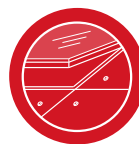
Fenêtre de toiture