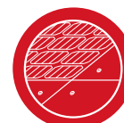
Plaques complémentaires Aura